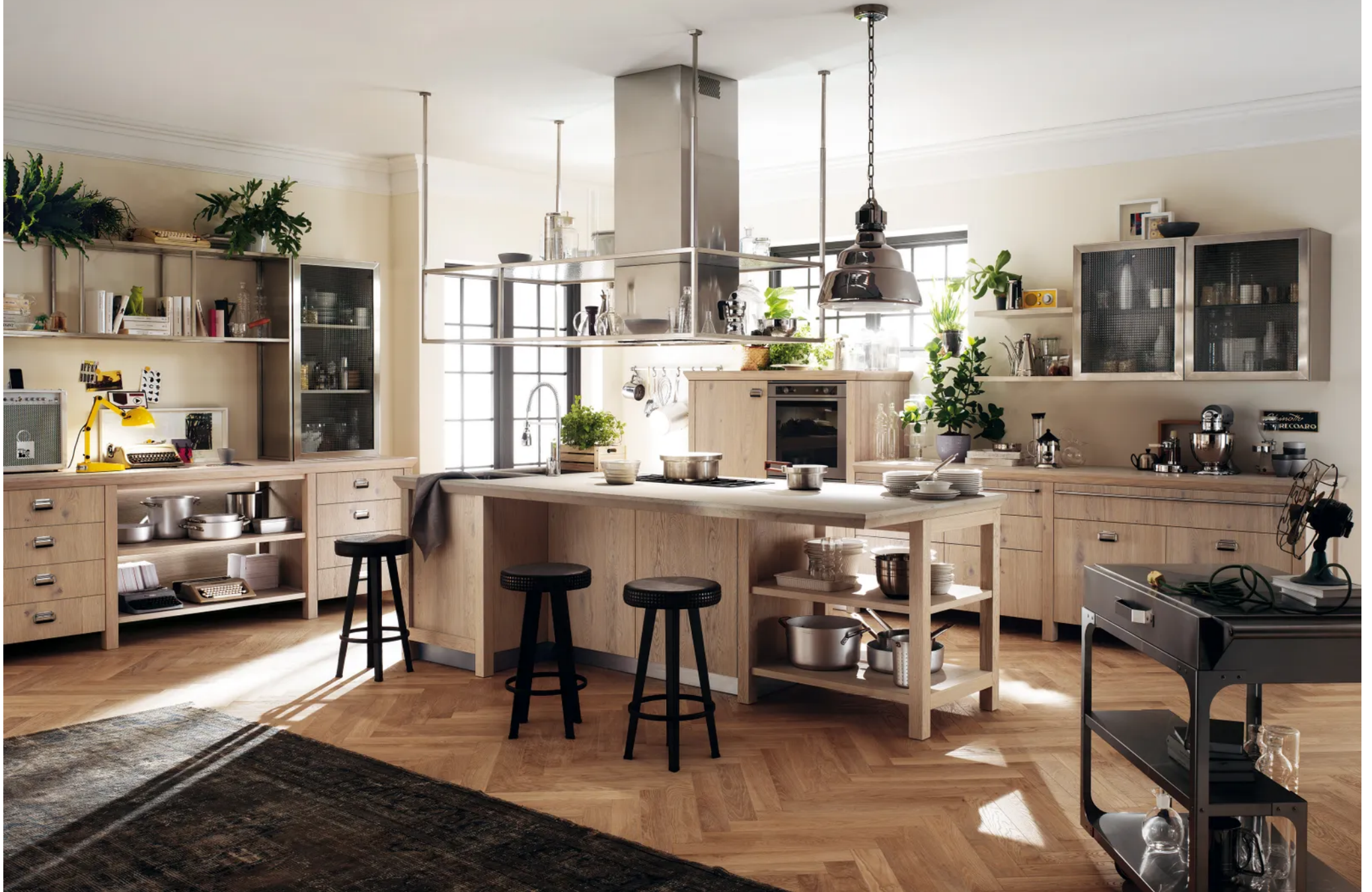
Collection Diesel Social Kitchen .